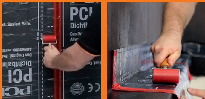
Einfach ankleben: Sauberes, schnelles Verarbeiten zeichnet PCI BT 21 aus. Auch Ecken und Unebenheiten lassen sich mit der Dichtbahn einfach ausführen.

Das System PCI BT 21 (KSK) bietet modernste Abdichtungstechnik im Kalt selbstklebverfahren. Im Zentrum steht die PCI BT 21 Dichtbahn „Allwetter“ . Sie besteht aus einer zweischichtigen, reißfesten Valéron®-Spezialfolie und einer stark klebenden Bitumenkautschuk-Dichtmasse. So bleiben Kelleraußenwände dauerhaft sicher vor Feuchtigkeit geschützt. Darüber hinaus eignet sich die KSK-Dichtbahn auch als Z- oder L-Abdichtung bei zweischaligem Mauerwerk.