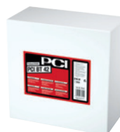
PCI BT 42 Fixband für den An- und Abschluss der Flächenabdichtung