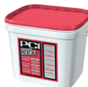
PCI BT 26 Voranstrich „Allwetter“ von 5 bis 30^{\circ}\text{C} . Haftaktiv für KSK-Dichtbahnen

Auch die Ergänzungsprodukte sind clever durchdacht. Die Arbeit auf der Baustelle wird dadurch stark erleichtert und ermöglicht einen noch schnelleren und sichereren Arbeitsfortschritt.