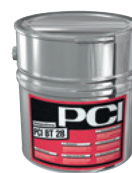
PCI BT 28 Spezialgrundierung (Winter) bis -5^{\circ}\text{C} vor dem Verkleben von KSK-Dichtbahnen