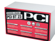
PCI BT 23 Dichtstreifen „Allwetter“ zur Abdichtung von Gebäudebauteilen